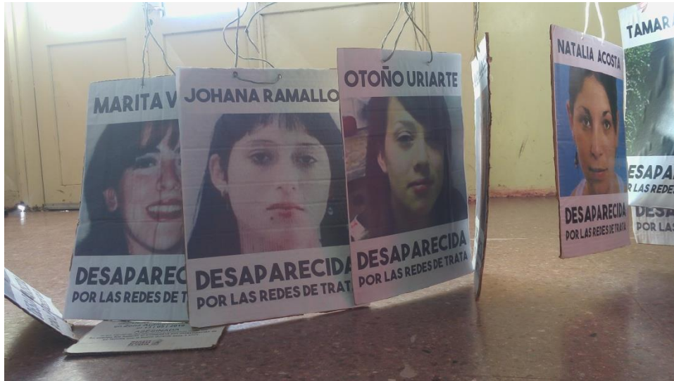
Registro propio. ENM. Trelew. 2018

Por otra parte, las acciones unen una multiplicidad de retratos de mujeres en redes de explotación sexual buscando magnificar la problemática. Y en un movimiento paradójico se las despersonaliza visibilizando ese hilo conductor que une a estas mujeres por su condición de víctimas de la violencia patriarcal.