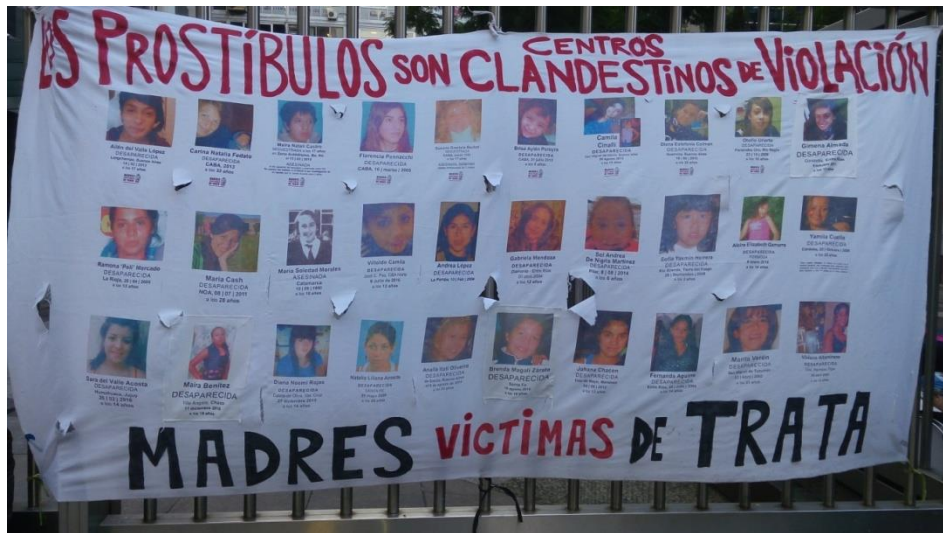
Registro propio. Martes Verde. Congreso. 2018.

Las analogías entre trata y dictadura buscaron entablar diálogos atemporales entre ambas experiencias apelando a una serie de metáforas. Los prostíbulos fueron puestos en paralelo a los centros clandestinos de detención (CCD) del terrorismo de estado como espacios de ejercicio sistemático de la violencia contra los cuerpos femeninos.